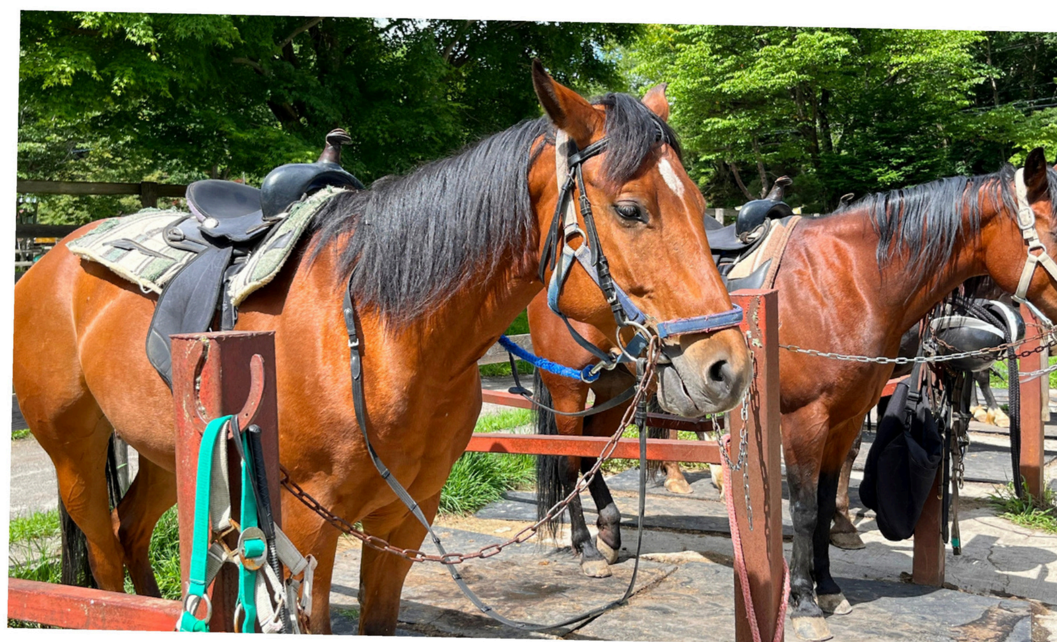
Maneggio di Mondonovo Mezza giornata – dai 6 anni