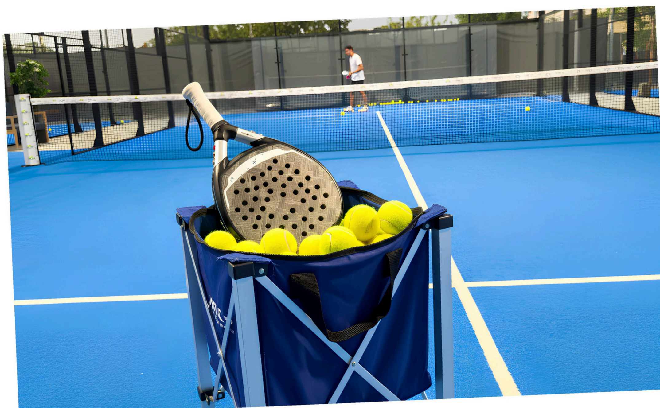
Padel di Molinella Mezza giornata – dai 9 anni