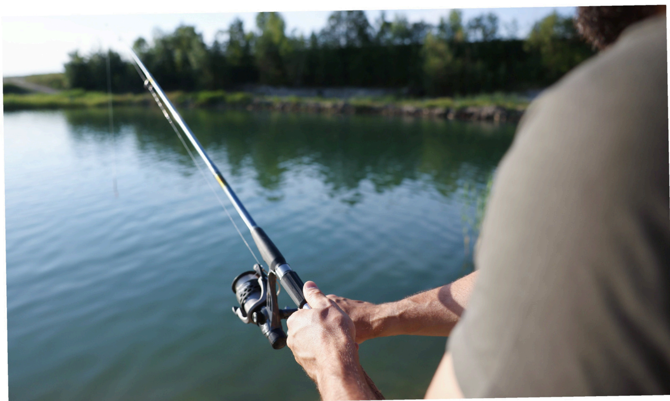
Laghetti di Molinella Mezza giornata – dai 6 anni