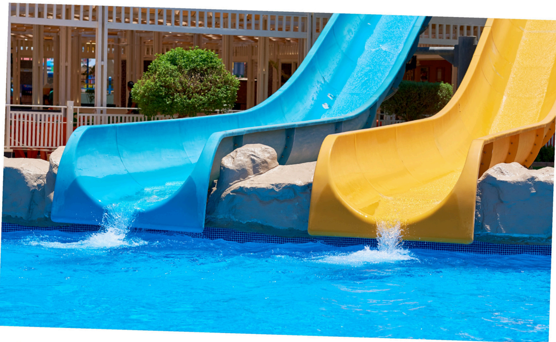
Acquajoss Conselice Dai 6 anni – a pagamento